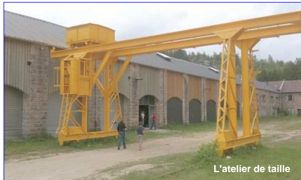
L'atelier de taille