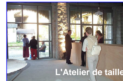
L'Atelier de taille

sur le site des carrières d'Euville : concerts, repas dansants, réunions, conférences, spectacles, etc.