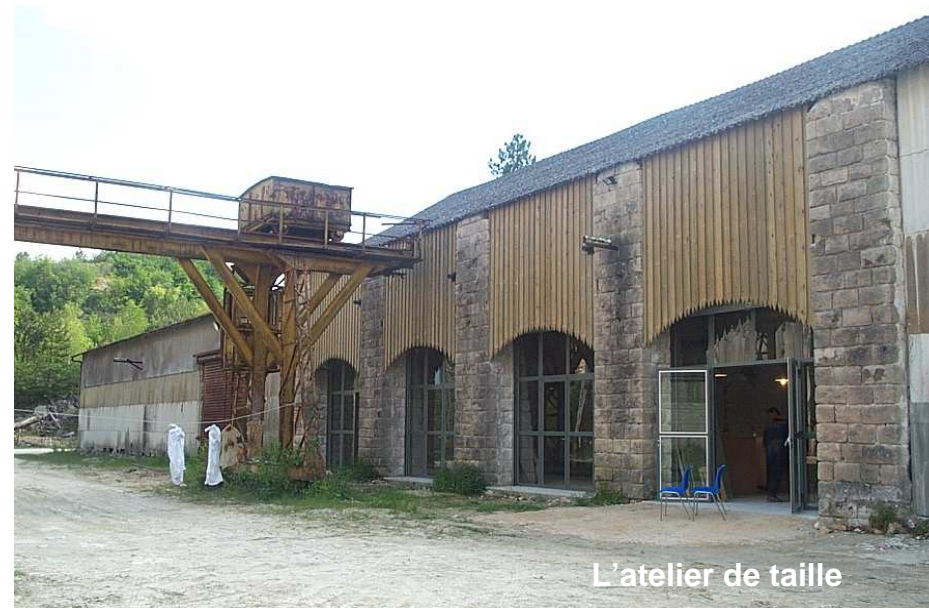
L'atelier de taille